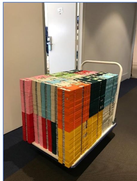
Carrito con las manos duplicadas