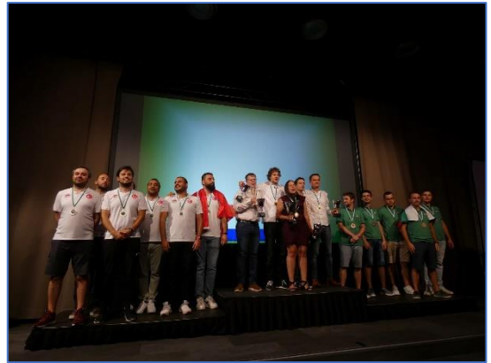
Podio sub 31