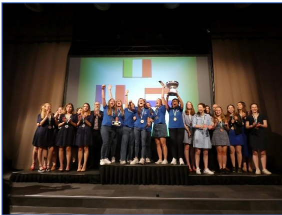
Podio sub 26 femenino