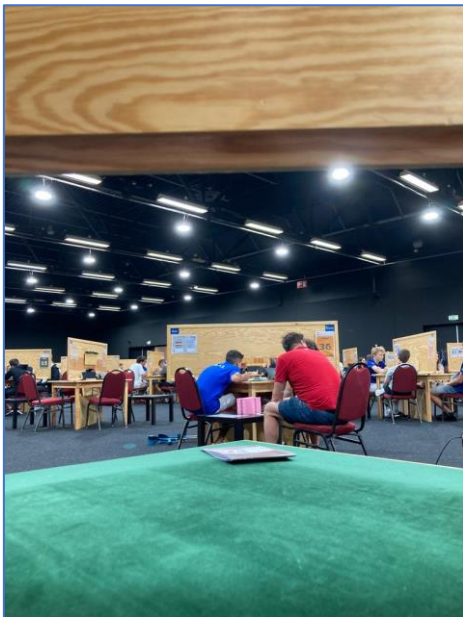
Sala de juego grande