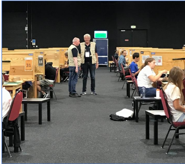
Directores del torneo