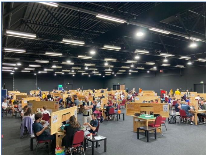
Sala de juego grande