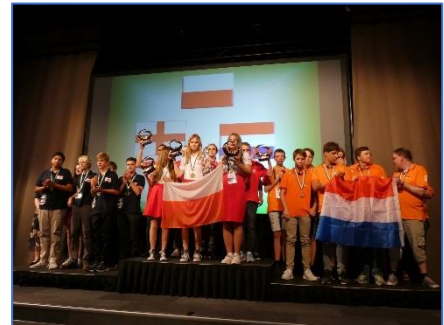
Podio sub 21