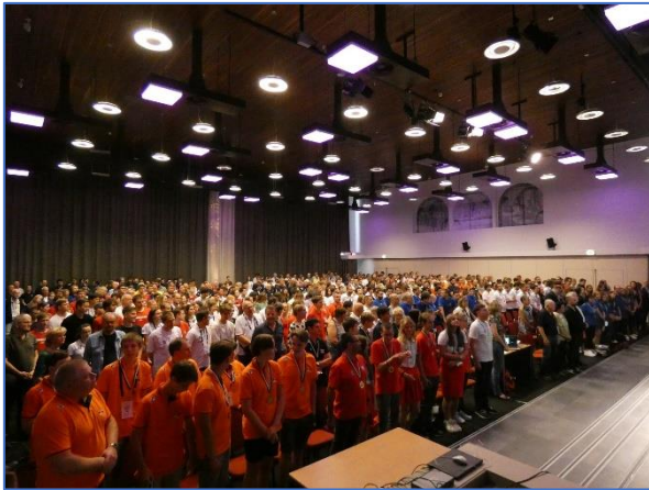
Ceremonia de clausura