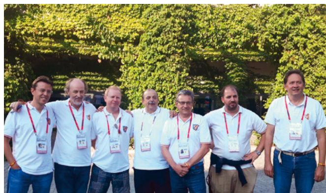
Equipo Open español en Wroclaw

El mundo de competición ha cambiado. Por una parte la limpieza ha ganado una batalla decisiva cuando, hace apenas un año, la iniciativa de Brogeland puso en evidencia la irregularidad de algunas parejas cuya falta de escrúpulos a la hora de adoptar acuerdos y artimañas era un secreto a voces. La descalificación de los tramposos ha abierto una nueva forma de competir y me gustaría señalar que España como país fue una de las naciones más dañada por la "actuación" de estos individuos. Por otra parte la composición de los equipos de algunos de los más prestigiosos países ha contribuido también a una igualdad de la que nos beneficiamos los equipos de la llamada segunda línea.