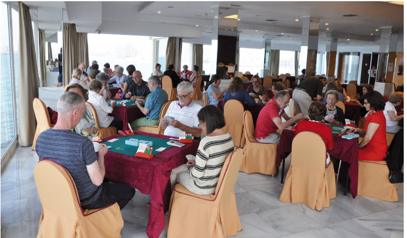
Vista general del torneo