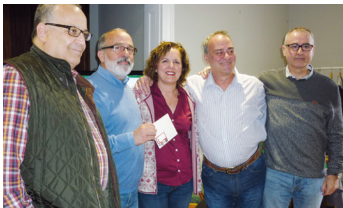
Campeones Zonal de Canarias: Equipo Tenerife

Después es de muchos años, Canarias volvió a contar con un Zonal de equipos, celebrado en Las Palmas el fin de semana de 3 al 5 de febrero. La vuelta fue por todo lo alto, con 9 equipos provenientes de varias islas (Gran Canaria, Tenerife y Lanzarote) y de la Península.