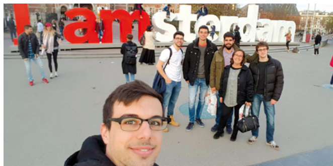
Amsterdam, sede del torneo

júnior de Barcelona participaron representando a España en el torneo White House International Juniors 2017, que se celebra cada año en Holanda.