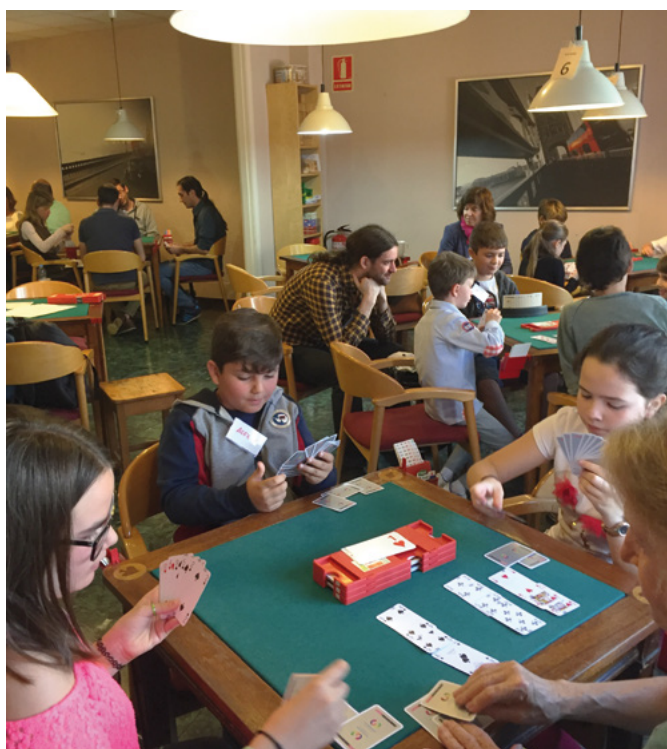
Torneo de escolares

Los niños han jugado 9 manos en una sesión de 2 horas y media, mientras que los Júnior han jugado 2 sesiones (mañana y tarde) de 21 manos cada una.