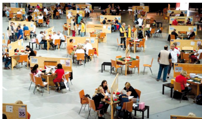
Aspecto de la sala principal de juego