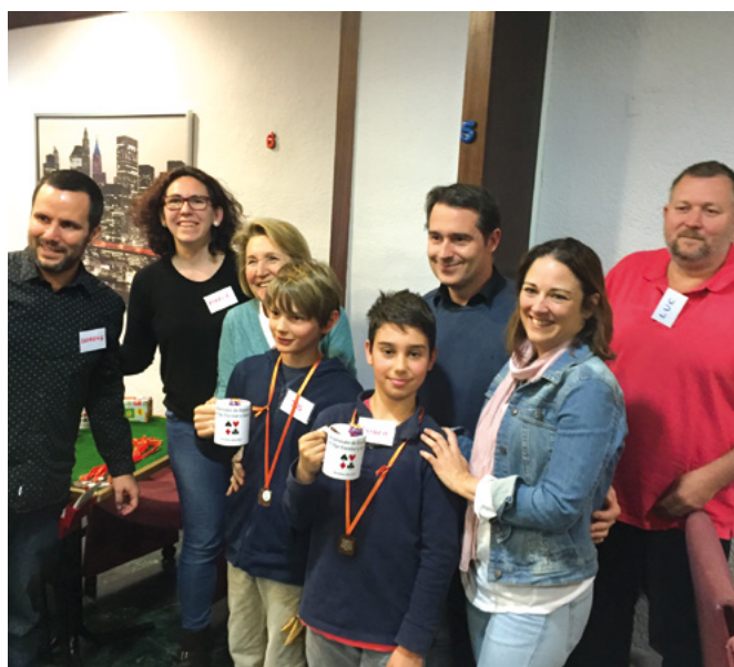
Entrega de premios