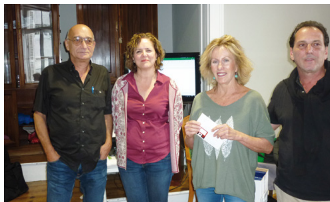
Subcampeones: Equipo Póker de Ases