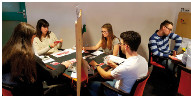
White House International 2017