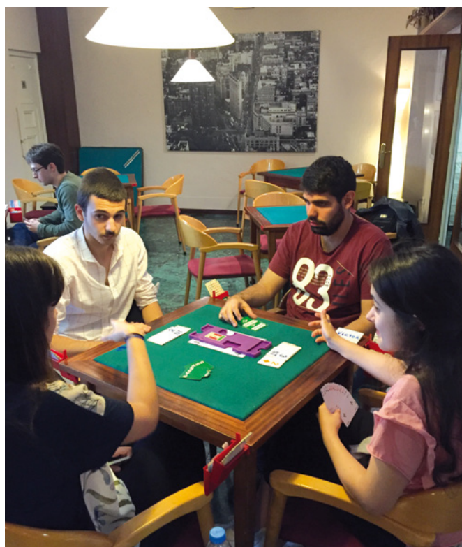
Torneo de júnior