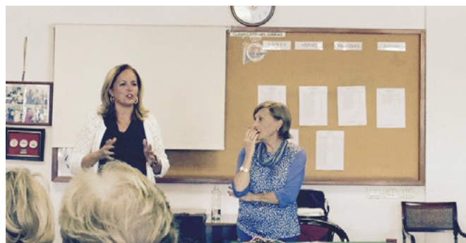
Curso de la Asociación Canaria de Bridge

La sección de bridge, excepto en los eventos federativos, sólo es accesible para los socios del Club, pero se recibe con mucho agrado a los jugadores federados no residentes en la isla siempre que contacten previamente con la Asociación Canaria de Bridge.