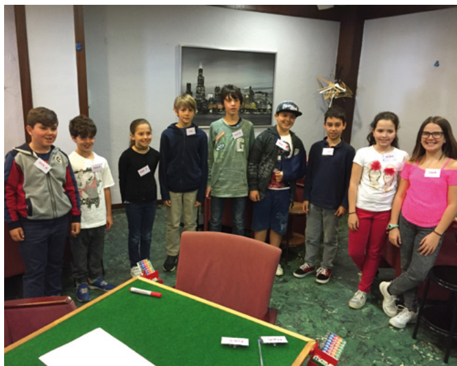
Parte del grupo de escolares

El sábado 22 de abril se disputó el Campeonato de España de bridge escolar y júnior en el club Mayda de Barcelona, con una participación de 12 júnior (10 de Barcelona y 2 de Madrid, a los que la AEB ayudó con el desplazamiento a Barcelona) y 11 escolares de una escuela de Premia (Barcelona).