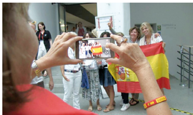
El equipo Damas español celebrando su clasificación

Probablemente España y Austria no contaran para la WBF entre el grupo de países favoritos pero eso no disculpa a los responsables porque en este mundillo todos nos conocemos. Hay muchos equipos nacionales cuya composición depende de la aparición de sponsors y jugadores que puedan financiar al resto del equipo y, en consecuencia, los resultados de una prueba no son extrapolables a otra. Bastaría con enumerar a los jugadores de una forma individual o por parejas consolidadas para saber la clase de equipos que presentaba cada país. Bulgaria, Austria y España somos un ejemplo bastante nítido.