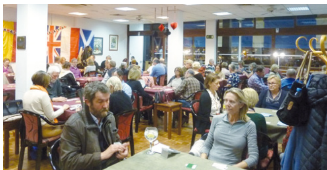
Salón principal durante Open Canarias 2017

Con grandes ventanales que le inundan de luz, aire acondicionado y megafonía, la sala principal propicia que sus dieciocho mesas estén completas en sus sesiones de lunes y viernes, por lo que normalmente precisa su sala anexa, que cuenta con nueve mesas más.