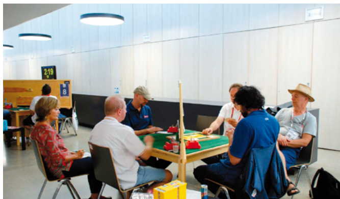
Un momento del match España - USA