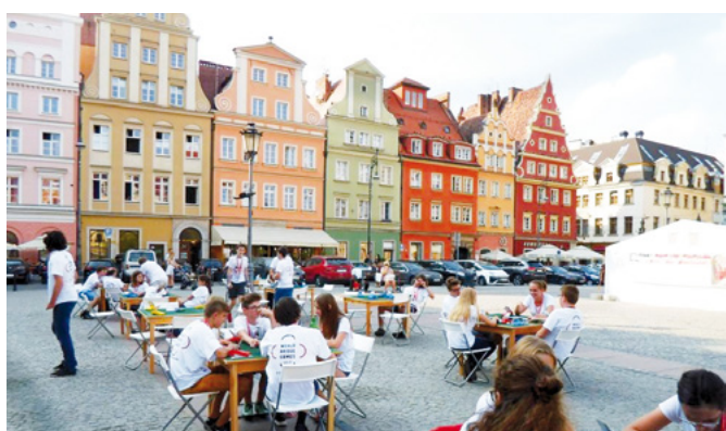
Plaza principal de Wroclaw Promoción del bridge durante el Campeonato

Wroclaw ha sido nombrada, junto a San Sebastián, la capital europea de la cultura en el año 2016. Razones sobradas tienen ambas capitales para tal galardón. Trate usted de “leer españolizando” la palabra Wroclaw. Es una pirueta lingual, un verdadero galimatías. Sin embargo, si le explican que la “c” intermedia se pronuncia como una “s” y que las “w” se leen como B y U respectivamente comprenderá que si nos referimos a Wroclaw hablamos de Breslau, de Breslavia.