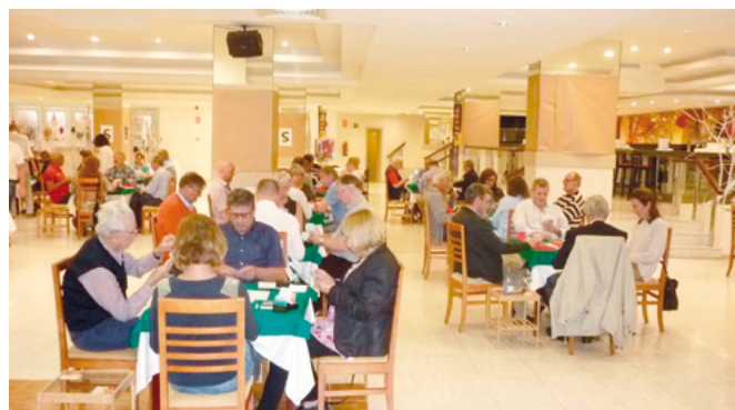
Vista del Torneo

En Puerto de la Cruz se disputó durante una semana, del 26 de marzo al 1 de abril, el XXX Festival Internacional de Bridge, organizado por la Asociación Canaria de Bridge y con alta participación internacional. El Festival contó además con la presencia de las más altas autoridades del bridge mundial: Giannarigo Rona (presidente de la World Bridge Federation) y Yves Aubry (presidente de la European Bridge League).