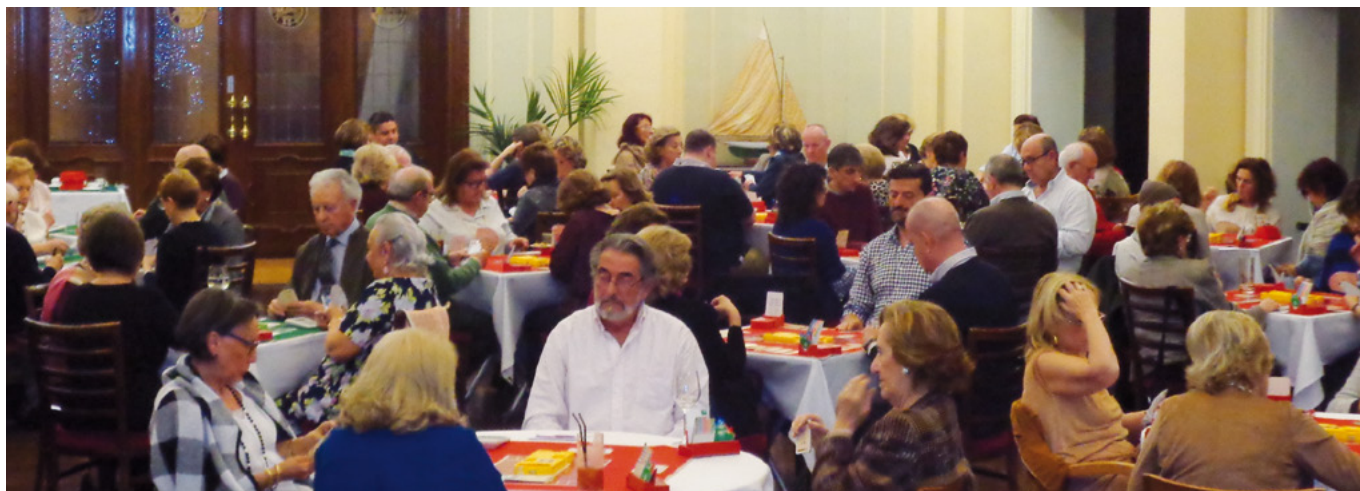
Vista del local de juego