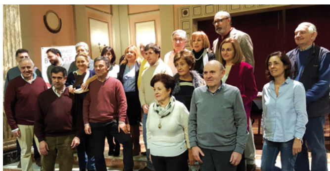
Todos los participantes con premios

También en Galicia (la tercera autonomía con más asociados a la AEB después de Madrid y Cataluña) se celebró el 17 y 18 de febrero el Torneo de Lugo, con un total de 55 parejas inscritas.